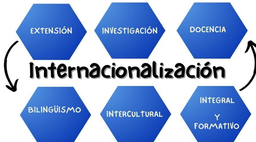
FIGURA 1. Elementos de la Internacionalización

En resumen, hay varios elementos que articulan las definiciones de la política de internacionalización de la Institución, entendiéndola desde la Investigación, la Extensión, Docencia y Bilingüismo, con un enfoque Intercultural, Integral y Formativo, tal como se explica en la Figura 1