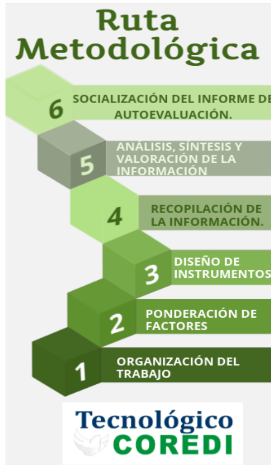
Ilustración 1. Ruta Metodológica